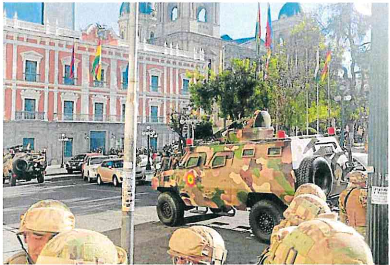
Militares sublevados toman posiciones frente a la sede del Gobierno de Bolivia, en La Paz.

Hasta el lugar se acercó el ministro de Gobierno, Eduardo del Castillo. Asistió al despliegue de los militares que, protegidos por