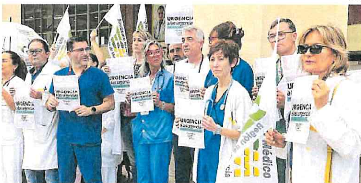
Protesta de médicos de Urgencias ayer, en el Hospital Virgen de la Arrixaca de Murcia.