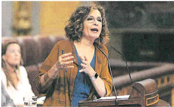
La vicepresidenta primera y ministra de Hacienda, María Jesús Montero, interviene en el Congreso.

Su cuantía se calcula a partir de los recursos tributarios que se estima se ingresarán a lo largo del ejercicio en concepto de IRPF (la