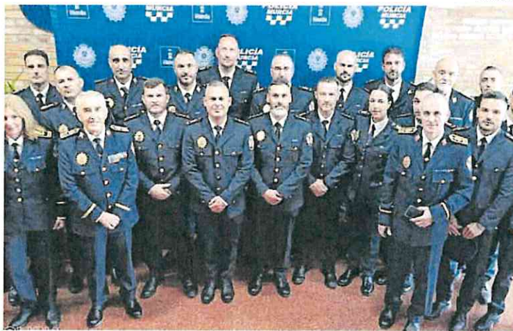
Nuevos inspectores y subinspectores, tras el curso selectivo de formación.

Desde Somos Sindicalistas explican que han solicitado esta medida judicial al entender que «ante la posibilidad de que las presuntas irregularidades sobre la falta de ti-