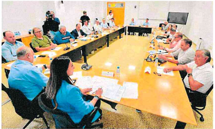
Reunión de la Mesa Regional del Cítrico, este lunes en la Consejería de Agricultura.