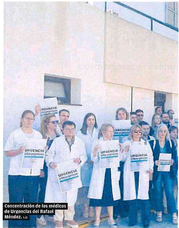
Concentración de los médicos de Urgencias del Rafael Méndez. I.A.

La exigencia de reconvertir en filios discontinuos a decenas de miles de eventuales que trabajaban para las empresas de trabajo temporal (ETT) y para otras compañías que solo ofrecen trabajo en determinados momentos del año hace que Murcia esté, junto con Andalucía y Extremadura, entre las comunidades que más han reducido su tasa de temporalidad, aunque las tres continúan en los puestos de cabeza.