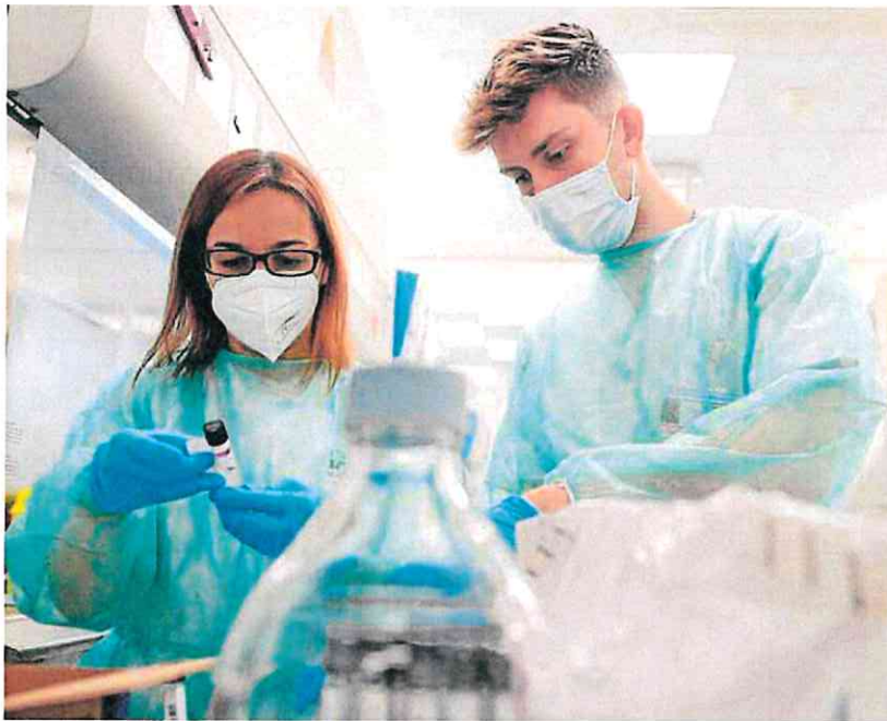
Dos jóvenes investigadores trabajando en un laboratorio español.

La nueva propuesta de mejora que ayer presentó Seguridad Social es mucho más favorable a los intereses de todas aquellas per-