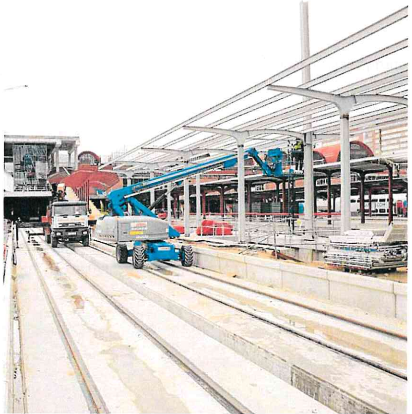
Obras de ampliación de la playa de vías para la alta velocidad en la estación de Madrid-Chamartín.