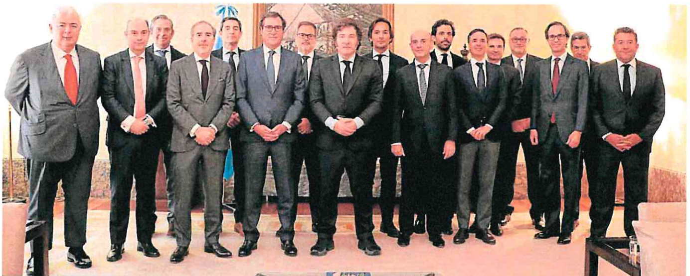
El presidente argentino, Javier Milei, el sábado con el presidente de la CEOE, Antonio Garamendi, y ejecutivos de las principales firmas españolas.

«Desde finales de octubre contaremos con 21 frecuencias semanales entre Argentina y Europa y tres vuelos diarios, una capacidad récord superior a las rutas entre Nueva York y Miami con Madrid», apuntan desde Iberia. Su actividad genera en Argentina 12.300 empleos, «con una remuneración 5,6 veces mayor que el promedio del país», indican. «Una actividad que incrementa el PIB turístico de España y Argentina en casi 197 millones», insisten desde la compañía.