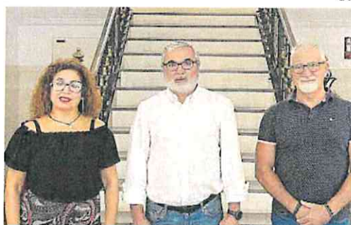
Concejales de Vox en el Ayuntamiento de Cieza.

No son los únicos que quieren cambiar el sistema, ya que Vox también ha mostrado su intención de reformar la normativa. ■