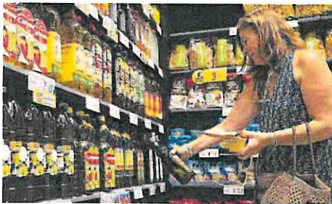
Una mujer compra aceite de oliva en un supermercado.