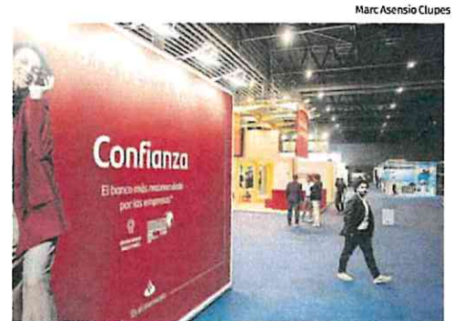
Anuncio de un banco en un congreso inmobiliario en Barcelona.

Dada la evolución del primer semestre, es más que probable que el sector supere en 2024 el récord de