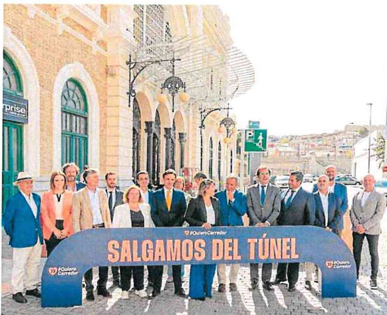
Empresarios, autoridades y miembros de la sociedad civil, ayer, en la estación de Cartagena.