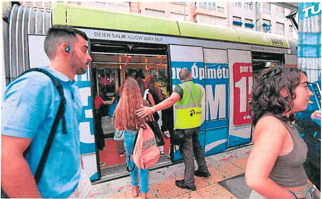
Viajeros del tranvía en la parada de Ronda de Levante. Este año se alcanzarán los 9 millones de usuarios.

Sobre la ampliación del tranvía, el actual equipo de la Consejería de Fomento, que dirige Jorge García Montoro, indicó a esta Redacción que «no conoce ni la negociación ni los términos del protocolo anunciado entre el Ministerio y el Ayuntamiento de Murcia. En cualquier caso, la Consejería muestra su disposición a reunirse con el fin de conocer los detalles, las características y la dimensión del proyecto, así como, a estudiar y evaluar posibles vías de colaboración. Pero el primer paso, lógicamente, es conocer lo acordado», señaló.