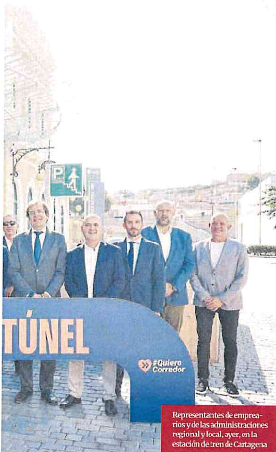
Representantes de empresarios y de las administraciones regional y local, ayer, en la estación de tren de Cartagena

El sindicato considera que la conexión Murcia con Cartagena va muy retrasada y hay que impulsar los proyectos de las obras, y resolver el problema de la entrada de la línea a la histórica estación de la ciudad. «El acuerdo de las tres administraciones de utilizar el actual trazado no lo resuelve. Hay una oportunidad histórica de resolver la integración», destacan. ■