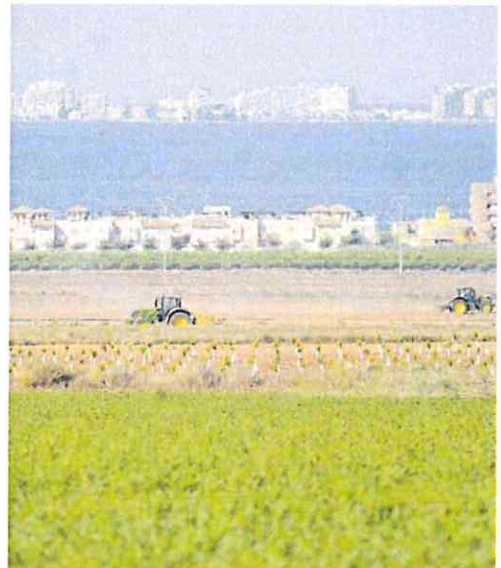
Imagen de archivo de una explotación agraria cercana al Mar Menor

Otra estimación del estudio, que se circunscribe únicamente a la Región de Murcia, cifra en más de 12.000 hectáreas esa reducción. Con mayor o menor número, la realidad es que con cualquiera de las previsiones y datos seleccionados, siempre habrá que reducir la superficie de producción agrícola. Aunque, según Barea, tendrían que primar al pequeño y mediano agricultor frente a las grandes corporaciones de la agroindustria: «No es lo mismo reducir a los pequeños agricultores que a las grandes empresas. Necesi-