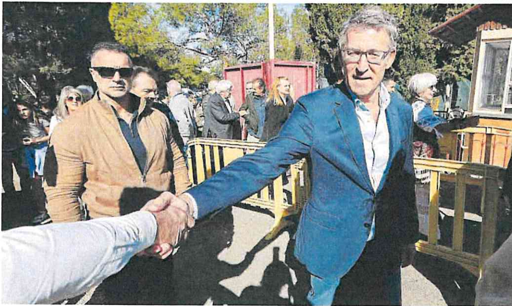
El presidente del PP, Alberto Núñez Feijóo, durante el día del afiliado, el pasado sábado en Zaragoza.