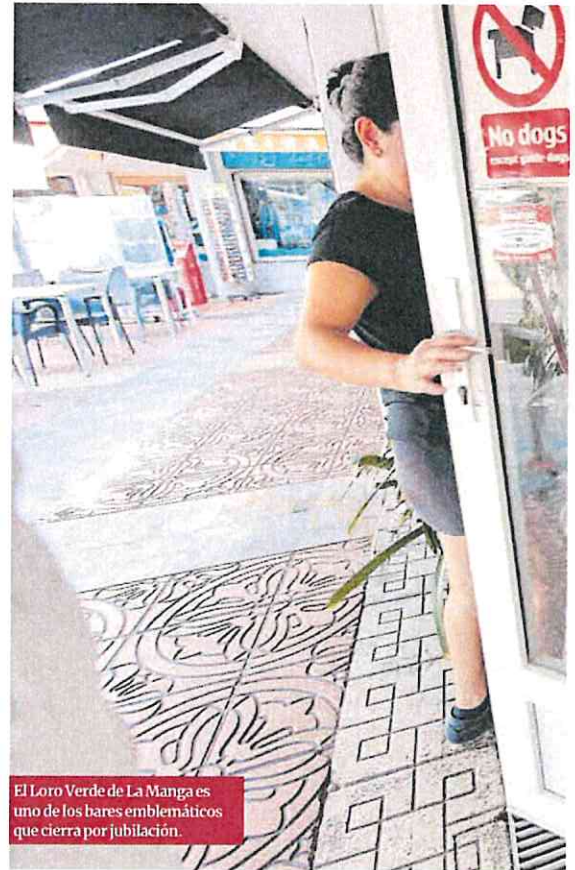
El Loro Verde de La Manga es uno de los bares emblemáticos que cierra por jubilación.

La falta de personal suficientemente preparado se ha agudizado al llegar la temporada de verano con la reapertura de los negocios de las playas. ■