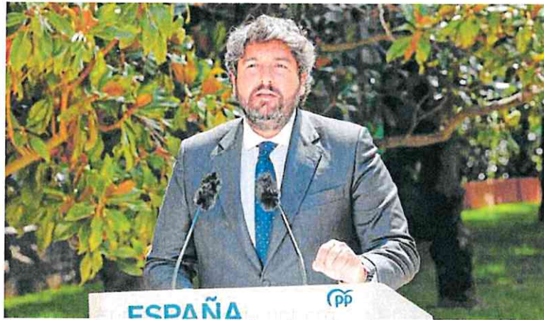
Fernando López Miras, ayer en Madrid, tras la reunión con los presidentes de su partido.

En su recurrente mensaje de vincular inmigración ilegal y delincuencia, el líder de Vox habló de «degradación e inseguridad» en las zonas próximas a este tipo de instalaciones e incluso lo vinculó también a las cifras de delitos de menores recogida en la memoria anual de la Fiscalía presentada el pasado jueves.