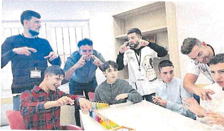
Jóvenes con discapacidad participan en los talleres de uno de los centros de día de la Región.