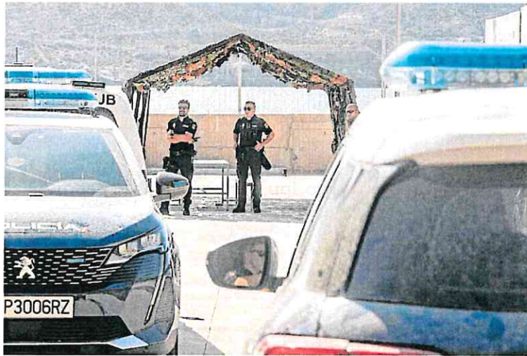
Dos policías del servicio de seguridad del CATE, bajo el toldo.

El sindicato policial recordó que, dada la situación de traslado del CATE a su nueva ubicación en La Algameca, su capacidad se ha visto reducida a la mi-