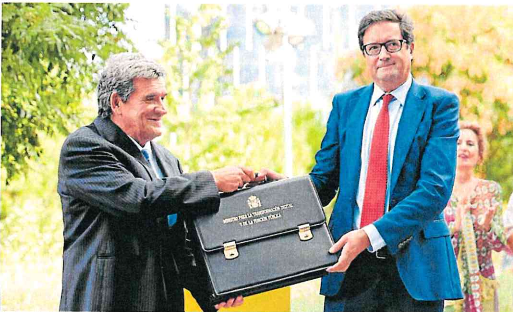
El gobernador del Banco de España, José Luis Escrivá, entrega la cartera de Transformación Digital a Óscar López.

Sobre Sánchez, el nuevo ministro lo elogió por ser alguien que «no se conforma, no se rinde, suele ir por delante y está convirtiendo a España en un país referente».