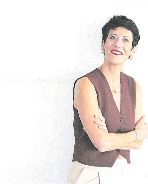
Elma Saiz, ministra de Inclusión, Seguridad Social y Migraciones, ayer en Sevilla.

— No. La política migratoria del Gobierno de ultraderecha de la señora Meloni es radicalmente opuesta a una política migratoria que ponga en el centro los derechos humanos. El miércoles escuché en el Congreso de los Diputados por parte de Vox, que quiero recordar que es socio del partido de Meloni en Italia, una afirmación que equipara a las mafias que trafican con seres humanos a la atención de las