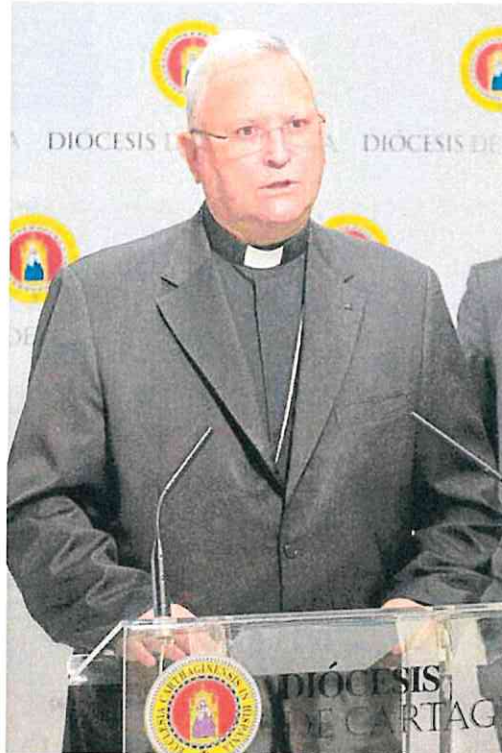
El obispo José Manuel Lorca Planes.

Asimismo, puede darse el caso de que siga como obispo más tiempo; o que lo haga como administración apostólica; se puede nombrar un obispo definitivo que lo sustituya; o, incluso, previamente a la renuncia, pueden nombrar un coadjutor que asumirá el cargo en el momento en que se acepte la renuncia. Este último caso