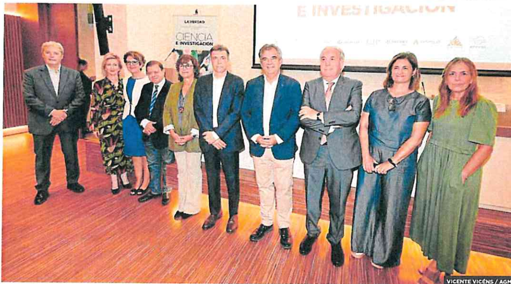
VICENTE VICENS / AGM