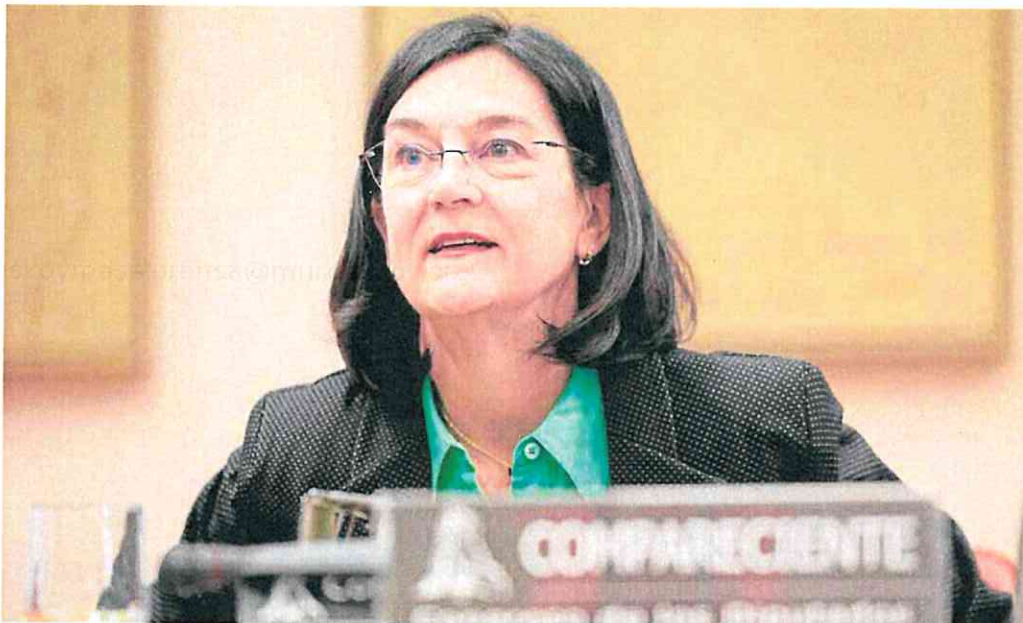
Cani Fernández, presidenta de la CNMC, ayer en el Congreso de los Diputados.

A todo ello se suma el difícil ejercicio de comparar los datos de la oferta. La presidenta de la CNMC insistió en que las cifras de ambas entidades «en muchas ocasiones no son compatibles», a diferencia de lo que suele ocurrir en otro tipo de ofertas de carácter amigable «en las que se