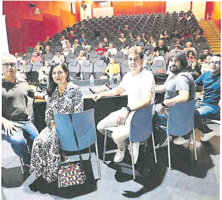
La asociación integrada por los solicitantes de ayudas del IDAE celebró ayer una asamblea.

Advierten de que cuando acaben los plazos establecidos por la Unión Europea para resolver los