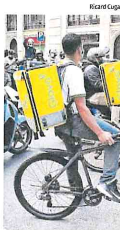
Un repartidor de Glovo.

parecer en las próximas semanas. Y, posteriormente, le tocará el turno a Pierre, al que se le acusa de supuestamente no atender los requerimientos de la Inspección de Trabajo y varias sentencias y no reconocer a los repartidores como asalariados, por lo que se les «menoscaba y suprime», según la fis-