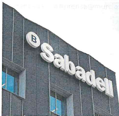
Edificio del Banco Sabadell.

Este pago forma parte de los 2.900 millones a cargo de los ejercicios de 2024 y 2025 que ya anunció el banco y equivalen a 53 céntimos por título y «cerca del 28% sobre la cotización actual». Esta primera remuneración de este ciclo supone «solo el 15% del total previsto para el período». El banco había estimado inicialmente que los dividendos ascenderían a 2.400 millones, pero decidió elevarlos a 2.900 millones tras los resultados récord de primer