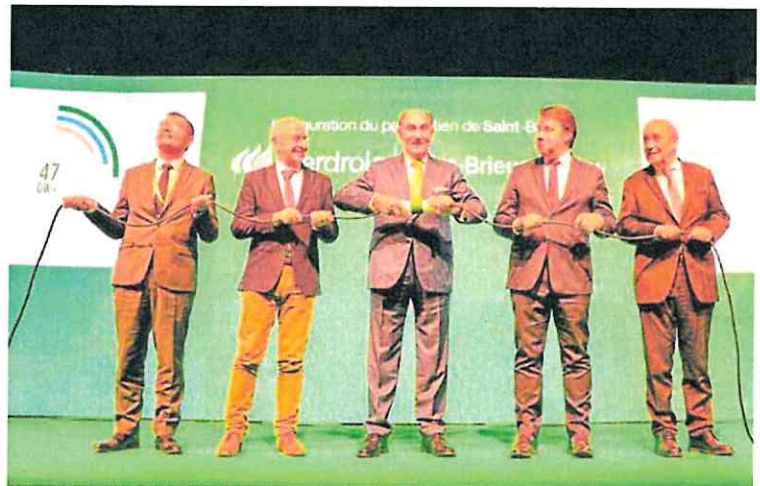
El presidente de Iberdrola, Ignacio Galán (c), con las autoridades galas, ayer en Saint-Brieuc (Francia).

Ya previamente había habido varias sentencias que establecían que los cinco días de permiso deben computarse en días laborables hábiles y no naturales. De esta manera, si la hospitalización o enfermedad coincide con el fin de semana o festivo esos días no computarán a dichos efectos.