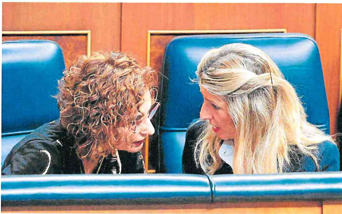
La ministra de Hacienda, María Jesús Montero, conversa en el Congreso con la titular de Trabajo, Yolanda Díaz.

El sindicato de los técnicos de Hacienda (Gestha) señala que cuando se apruebe definitivamente