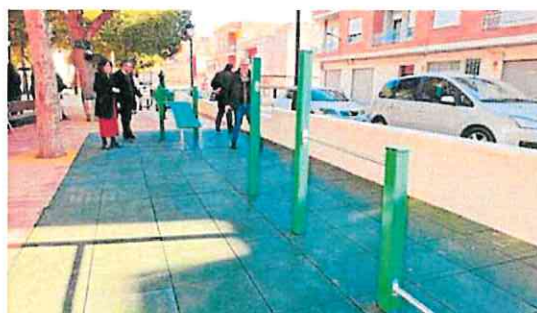
El alcalde Buendía inauguró ayer los nuevos elementos. AYTO.

«Todos estos elementos ya se pueden utilizar por parte de todos aquellos ciudadanos que deseen mejorar su musculatura, función cardíaca, pulmonar y articulaciones, además de la flexibilidad, la coordinación y la agilidad», apuntaron ayer fuentes municipales.