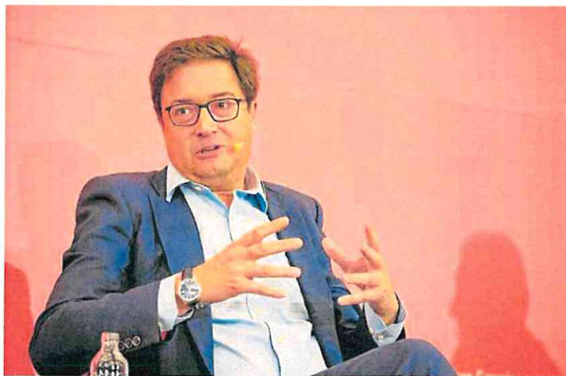
El ministro de Transformación Digital y de la Función Pública, Óscar López.

«Existe una clara descompensación entre la oferta y la demanda lo que, sumado a una financiación cada vez más atractiva, convierte las subidas de precio en algo habitual dentro del mercado inmobiliario», apunta al respecto Ferrán Font, director de estudios de Pisos.com.