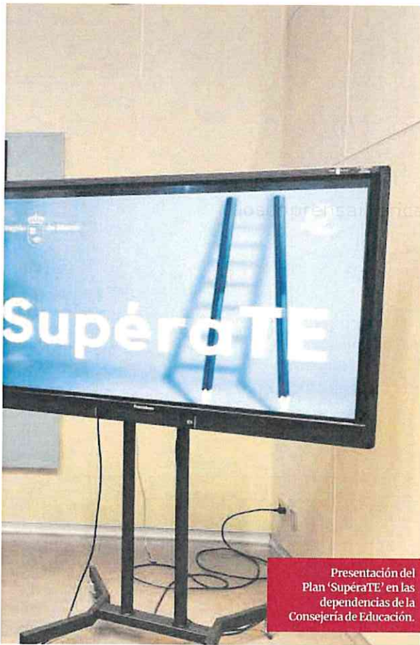
Presentación del Plan 'Supérate' en las dependencias de la Consejería de Educación.

Añade que «los miembros del tribunal adquieren un papel importante y por ello debe guardar las máximas garantías de transparencia y condiciones de trabajo. Desde ANPE reclamamos a la Consejería reuniones para valorar y evaluar todas las necesidades y adoptar todas las medidas necesarias con atención suficiente y evitar problemas en las condiciones de trabajo de los miembros del tribunal, así como en cada una de las partes del proceso selectivo». Entre las medidas que propone el sindicato figura el establecimiento de «una ratio no superior a 40 opositores por tribunal, que las horas de trabajo no excedan de la jornada lectiva de los docentes y que las aulas estén climatizadas para poder combatir las olas de calor que se producen en Murcia en los meses de junio y julio. Así, tanto los opositores como los miembros del tribunal podrán rendir al máximo y afrontar las pruebas en condiciones óptimas».