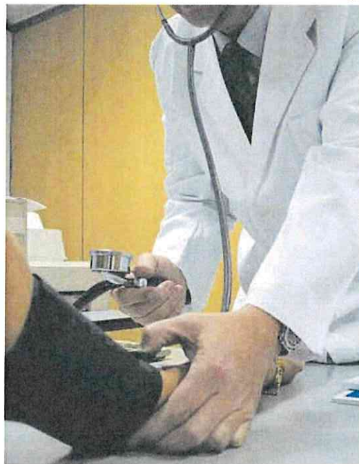
Un médico toma la tensión a un paciente en una consulta.

País Vasco es el territorio con la tasa de absentismo más alta, el 9,8% (2,2 punto porcentuales más que en el trimestre anterior), seguido de Navarra, con un 8,9%