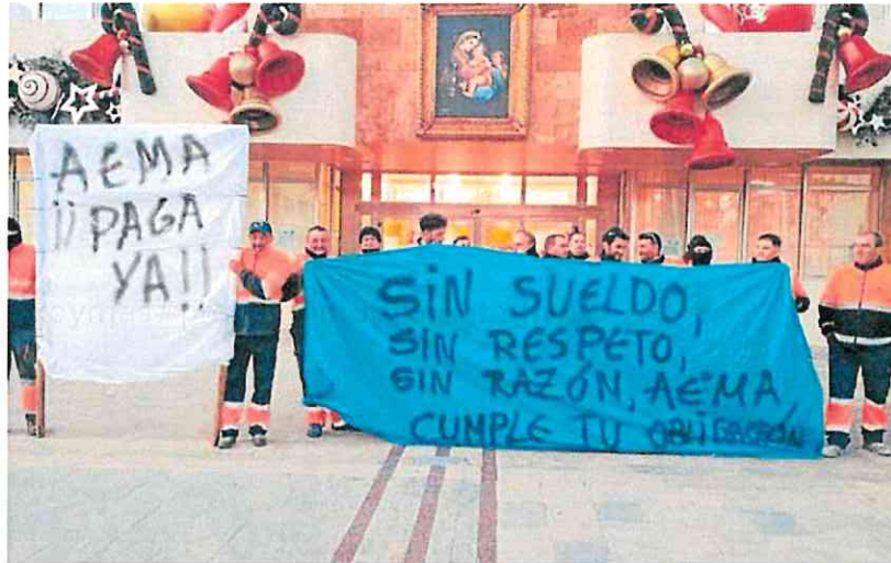
Los trabajadores de parques y jardines durante la protesta que hicieron ayer en la puerta del Ayuntamiento.