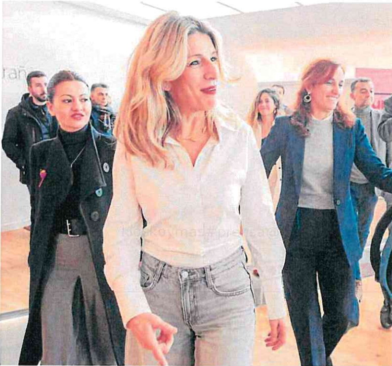
Yolanda Díaz reunió el viernes en Madrid a representantes de partidos de su espacio político.