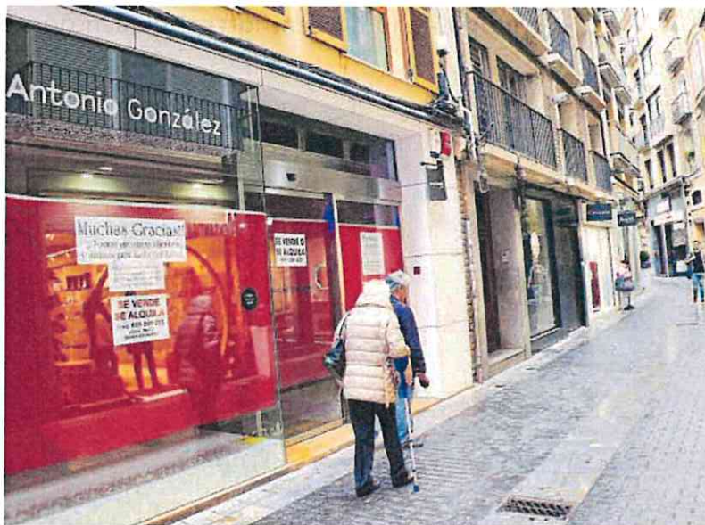
Un comercio cerrado en la calle Sociedad de Murcia.

ambos sectores ha sido relativamente moderado, dado que el pasado año han salido de la Seguridad Social 119 comerciantes y 79 afiliados del sector industrial.