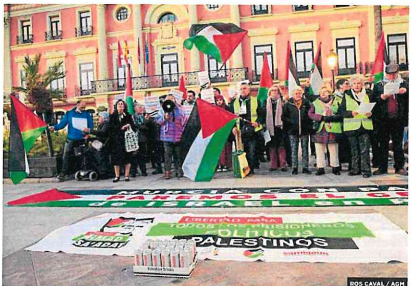
ROS CAVAL / AGM

Estas acciones formativas empezarán a impartirse a partir del mes de febrero en distintos municipios de la Región de Murcia, por lo que las personas interesadas en realizar alguna de ellas pueden conocer las que el SEF oferta en cada momento, accediendo al apartado 'Busco Formación', disponible en la página web www.sefcarm.es .