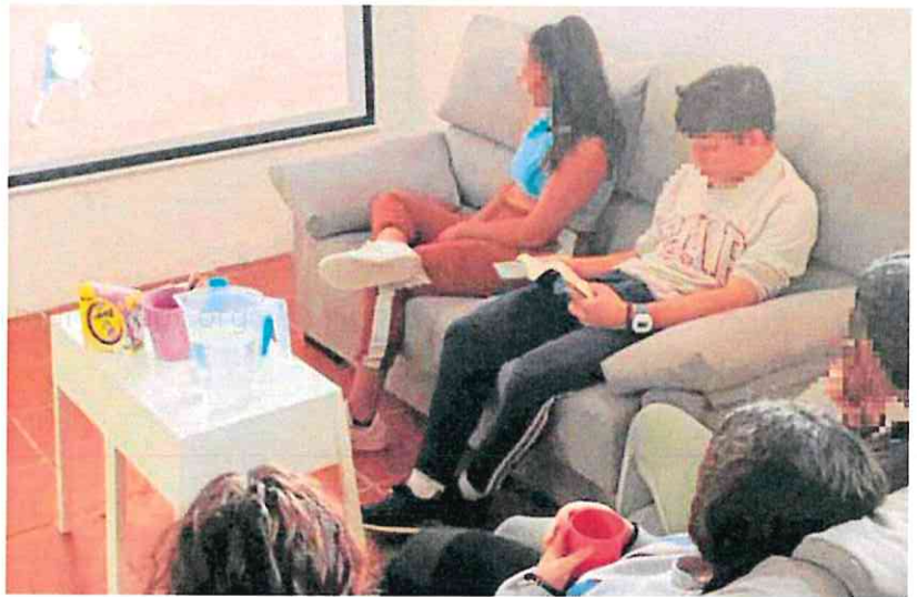
Usuarios de un centro de menores de la Región de Murcia, compartiendo un tiempo de ocio.

De entre las iniciativas ya realizadas, en el Gobierno regional destacaron el proyecto integral para la modernización y actualización del Hogar de Protección de