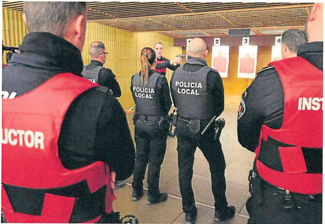
Un instructor de tiro de la Policía Local de Murcia, durante una clase práctica con otros agentes.