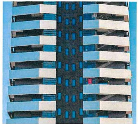
Pisos en Torrejón de Ardoz (Madrid). ÓSCAR CHAMORRO

El desafío se presenta así igual de complejo que el problema a solucionar. «La viabilidad técnica y jurídica de las propuestas plantea serias dudas» en torno a su éxito, apuntan los expertos de Ibercaja.