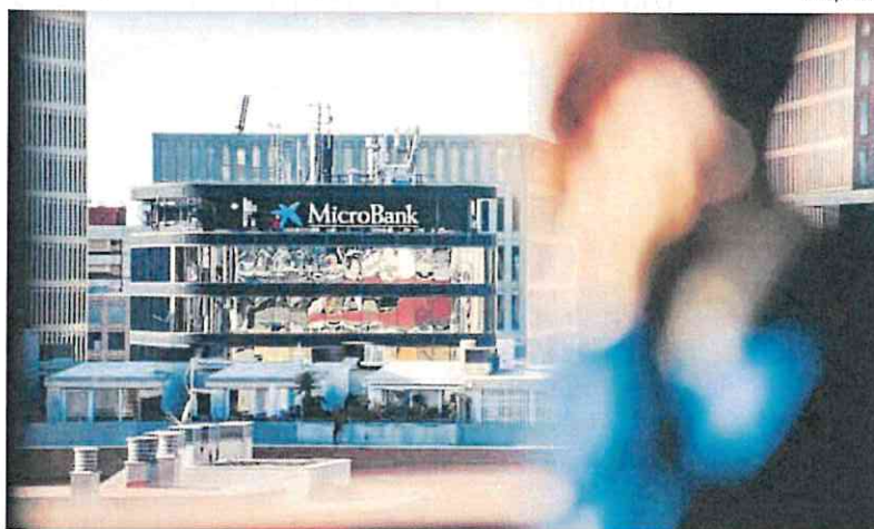
Sede de MicroBank en Barcelona.

Una de las grandes razones tras el fenómeno es lo mucho que aumenta la financiación dirigida a familias en situación de vulnerabilidad. MicroBank concedió en todo 2024, 200.300 microcréditos (casi un 70% más que en 2023) por valor de 1.400 millones de euros (un 63% más). El importe medio de estos préstamos está en torno a los 6.900 euros.