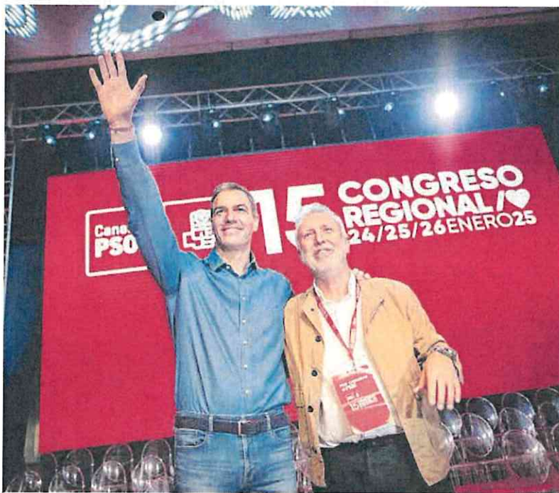
Pedro Sánchez, ayer, junto a Ángel Víctor Torres, en Santa Cruz de Tenerife.