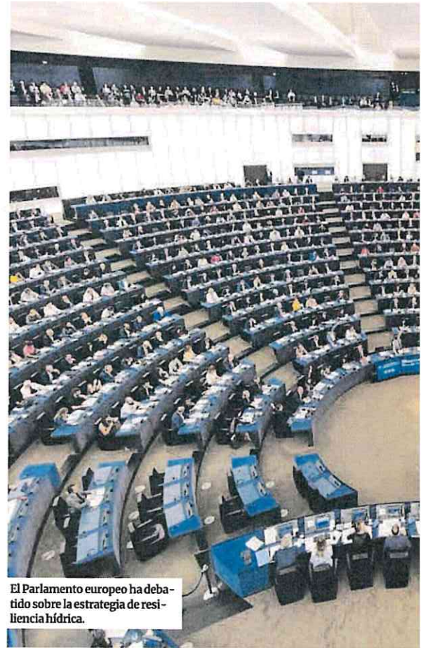
El Parlamento europeo ha debatido sobre la estrategia de resiliencia hídrica.

«La Región de Murcia ha crecido gracias a las aguas que han llegado a través de este acueducto y creo que desde Europa tienen que conocer los que hemos conseguido gracias a los caudales sobrantes de la cabecera del Tajo que nos han ayudado a prosperar económica, social y medioambientalmente», concluyó la titular de Agua. ■