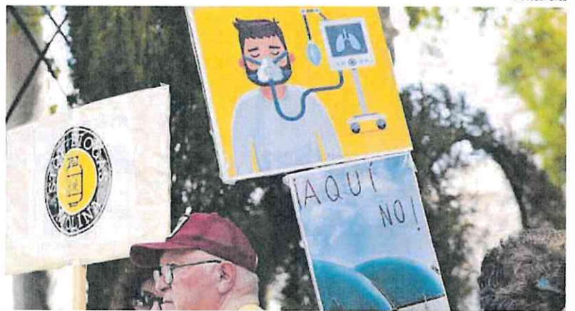
Los vecinos denuncian que estas instalaciones procesan residuos como purines, lodos o restos de matadero.

se nos expliquen bien las cosas. Pero el problema es que empresas de gas o las grandes cábricas de la Región quieren ponerlas rápido y están presionando mucho para que se realicen, ya que existen muchas subvenciones de Europa».