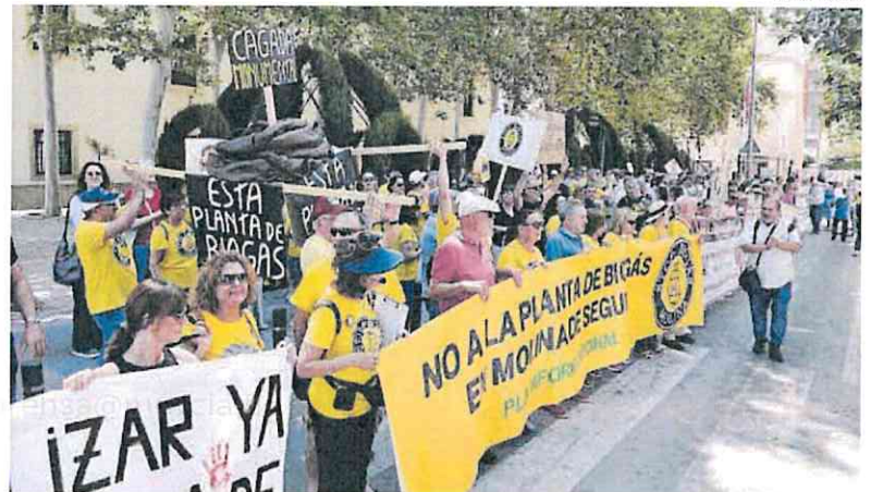
Los manifestantes llegaron de distintos municipios como Las Torres, Molina, Mula y Santomera.

Y es que lo tienen muy claro, explicó el portavoz de la plataforma de Molina, quien habló en nombre de los distintos municipios afectados: «Lo que queremos es que a nivel nacional exista una regulación, y también a nivel autonómico, sobre cómo se tiene que construir, qué tamaño pueden tener, qué tipo de plantas, y todo esto no se está respetando. Y hablo concretamente de la Región de Murcia. Sólo estamos pidiendo una moratoria, porque ninguno de nosotros somos bioquímicos ni nos dedicamos a esto». Ha añadido que «si el pueblo dice que no la quiere, por ahora hay que escucharle. No somos un grupo revolucionario loco. Queremos que se haga bien, y eso exige tiempo y que