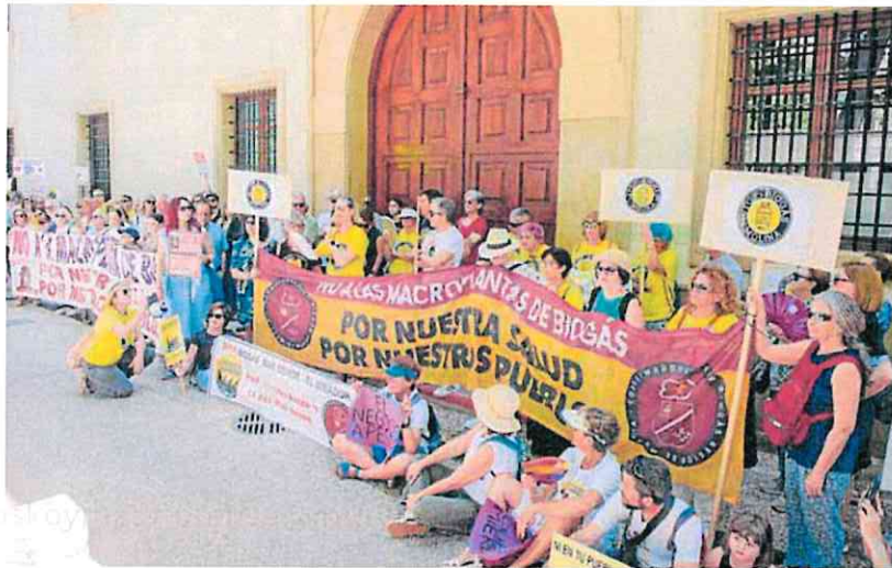
Manifstantes de las plataformas contra el biogás, ayer, a las puertas del Palacio de San Esteban.