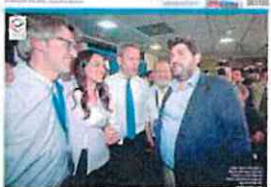
López Miras logra un contundente triunfo para el PP y hunde al PSOE de José Vélez

La ola contra Sánchez da la vuelta al mapa político español