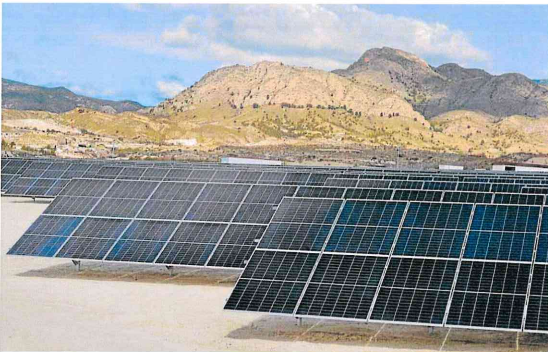
Planta solar en El Fenazar (Molina) gestionada por una sociedad participativa de cien familias de la Región de Murcia.

Los investigadores abogan por estrategias de planificación territorial mediante mapas de idoneidad en la Región