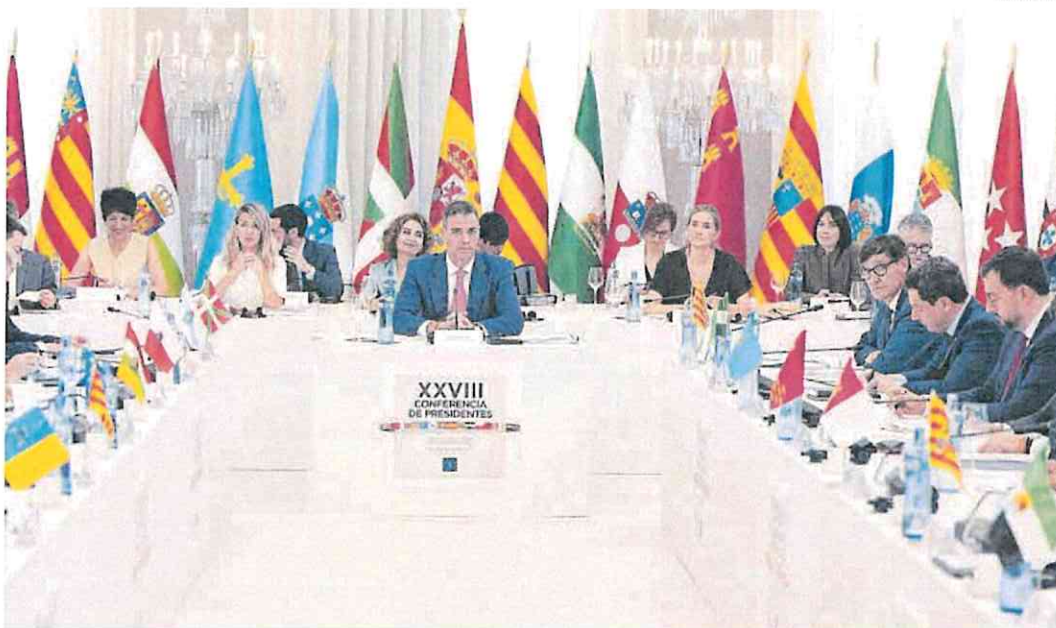
El presidente Sánchez, miembros del Gobierno y los presidentes autonómicos, ayer en Barcelona.