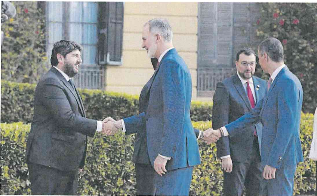
El presidente autonómico, Fernando López Miras, saluda al rey Felipe VI, ante presencia del presidente Pedro Sánchez.