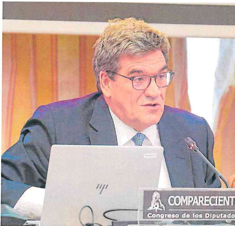
El gobernador del Banco de España, José Luis Escrivá, ayer en el Congreso.

Además, el gobernador quiso zanjar la polémica que ligaba la dimisión de Ángel Gavián a la presentación de este primer informe anual en el que la sostenibilidad de las pensiones se toca de puntillas: «Su salida no tiene nada que ver con el informe anual ni otras discrepancias», señaló. Y reiteró que Gavián necesitaba «nuevos horizontes profesiona-