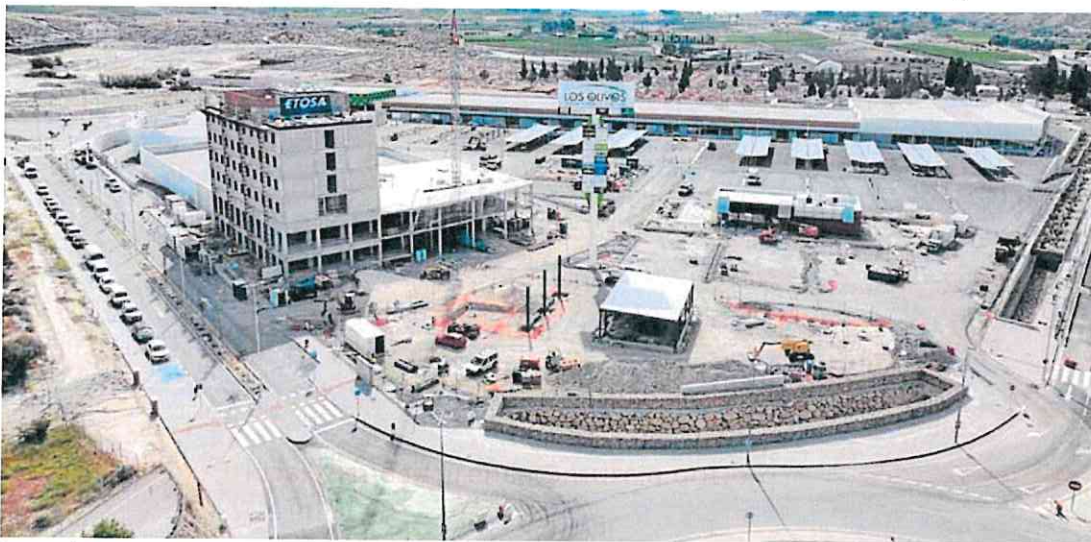
Imagen aérea de las instalaciones del nuevo parque comercial, que se encuentran ya en su fase final de construcción. c. c.