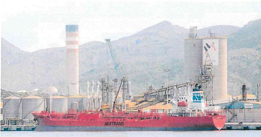
El Plan General contempla ampliar la superficie calificada como suelo urbano especial en el valle de Escombreras para facilitar el crecimiento del sector de las renovables.