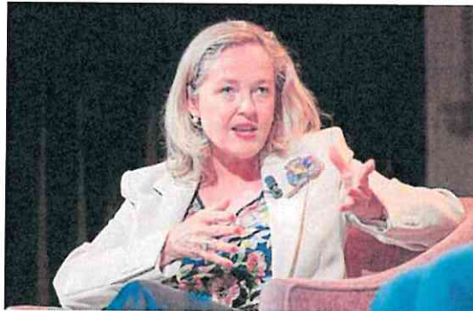
La presidenta del Banco Europeo de Inversiones, Nadia Calviño, en una conferencia, ayer, en el Ateneo de Madrid.

En este sentido, señaló que el BEI debe garantizar ese proceso de «avanzar hacia la transición energética para no depender de energías fósiles e ir hacia una energía eficiente y sostenible». Por ello, desveló que está trabajando «muy estrechamente» con la Comisión Europea, y en particular con Te-