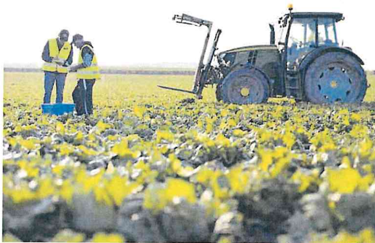
Campos de lechugas en la Región de Murcia.

Lo que hace este último movimiento es aglutinar toda la oferta y distorsionar los mercados. «Y eso sí nos preocupa muchísimo, porque ya hemos tenido procesos de concentración en otros sectores en la historia de la Región de Murcia y al final ha acabado con pueblos en