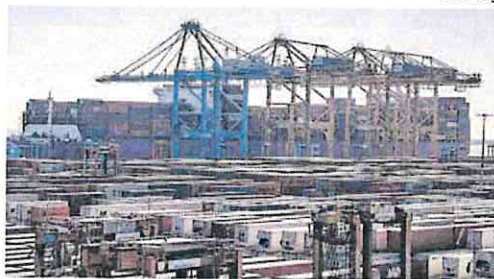
Terminal de contenedores del puerto del Barcelona.

según explicó el propio organismo. Por su parte, CaixaBank Research limita al 2,5% el crecimiento de la economía española previsto para 2025, según las nuevas proyecciones publicadas ayer por el servicio de estudios. «Preveemos que la eco-