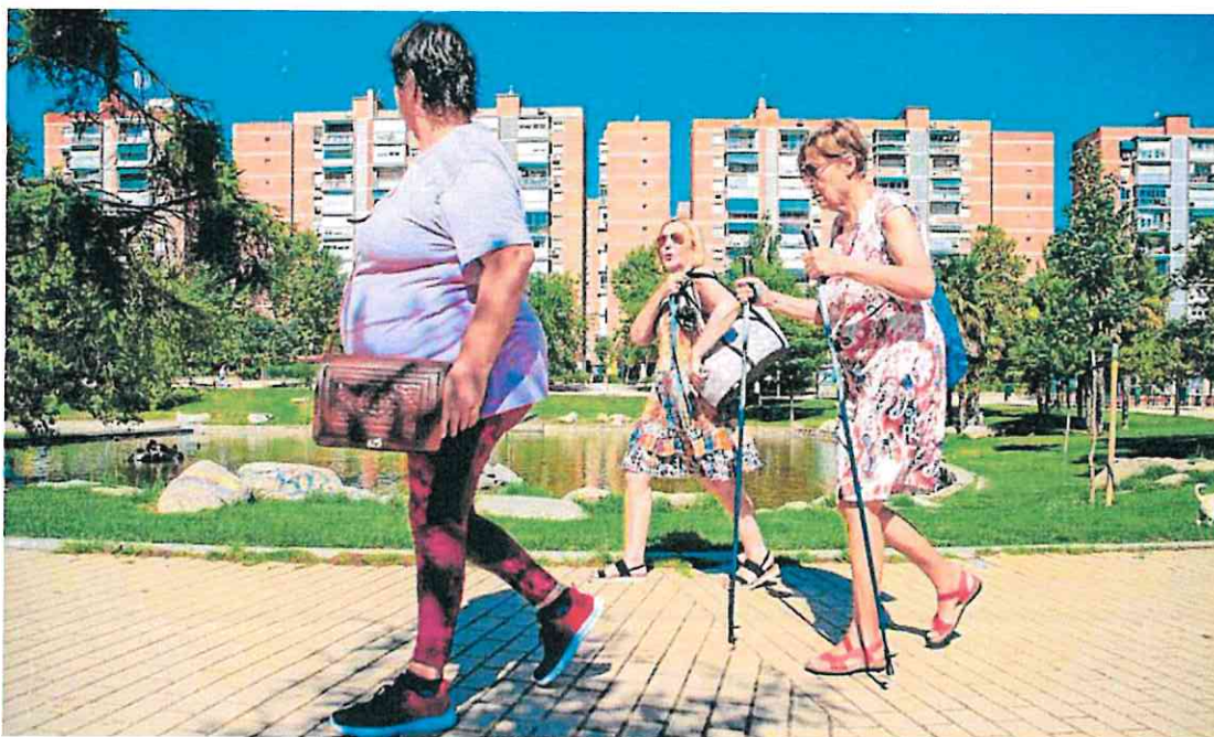
Un grupo de pensionistas pasea por un parque de Madrid. ANTONIO LÓPEZ DÍAZ

Por ello, estos profesionales defienden la necesidad de adoptar ajustes automáticos en las pensiones vinculados a la esperanza de vida y al crecimiento económico a semejanza de lo que han hecho otros países europeos.