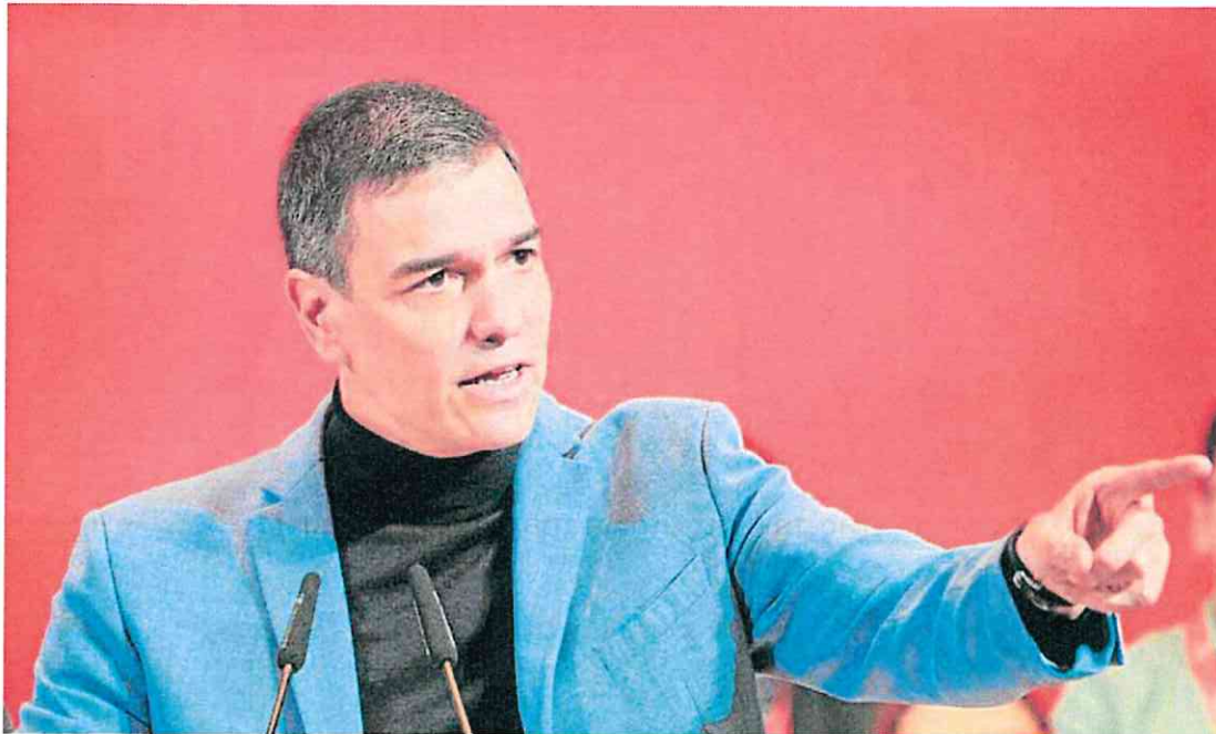
Pedro Sánchez, presidente del Gobierno, durante su discurso en la clausura del 15º Congreso del PSdeG-PSOE, ayer, en Santiago de Compostela.