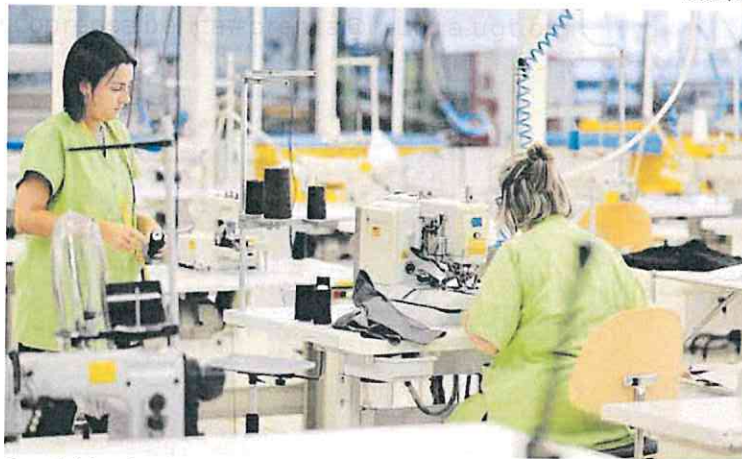
Dos trabajadoras de Inditex en Arteixo (A Coruña).

En 2024, España creció por encima de las previsiones y a un ritmo más acelerado que sus socios europeos. La acción de los fondos europeos, junto con los resultados del sector turismo, con cifras récord de 93,8 millones de viajeros, y la integración en el mercado laboral de los