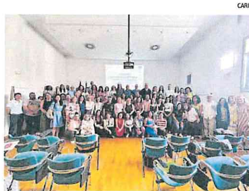
En el programa participan 15 entidades sin ánimo de lucro.

En el programa de apoyo y acompañamiento en los itinerarios laborales han participado, mediante el procedimiento de concurrencia competitiva, un total de 15 entidades sin ánimo de lucro, que han