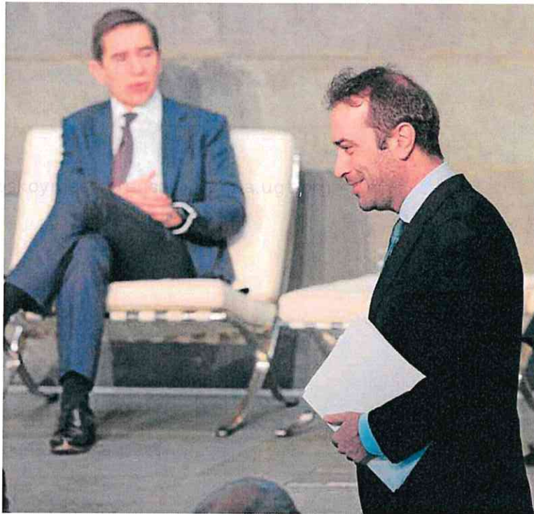
El ministro de Economía, Carlos Cuerdo, en un acto organizado ayer en Madrid por la AEB.

Fue el pasado 20 de diciembre cuando el Gobierno remitió a Bruselas su solicitud para este quinto pago, que incluía el compromiso para cumplir 71 hitos y objetivos correspondientes a las subvenciones y otros 13 para los préstamos. «De estos, 55 forman