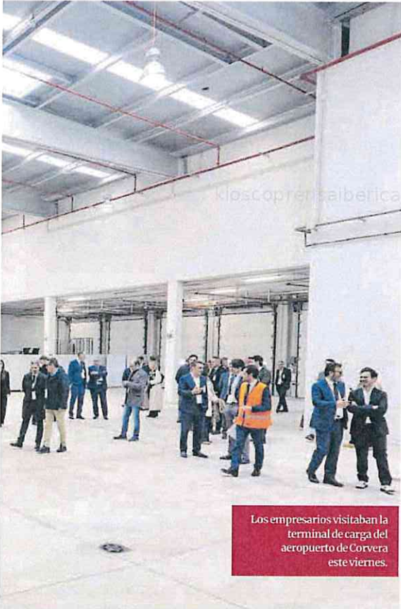
Los empresarios visitaban la terminal de carga del aeropuerto de Corvera este viernes.