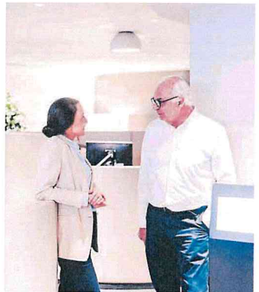
Cuenta con más de cuatro millones de clientes mayores de 65 años. CaixaBank

Así, en las oficinas de CaixaBank se ha implementado un plan de acompañamiento que prioriza la atención a personas en situación de vulnerabilidad para reducir tiempos de espera y ayudar en el acceso a todo tipo de servicios financieros como, por ejemplo, el uso de los cajero-