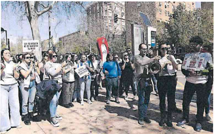
Un momento de la concentración de este viernes ante la Consejería de Política Social, en Murcia.