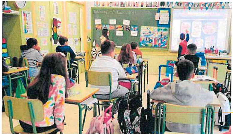
Alumnos del colegio Vicente Medina de la Orilla del Azarbe, de Murcia, en clase de Science.

Los docentes de Secundaria estarán obligados a acreditar el nivel de idioma C1, superior al B2 actual, para seguir en el programa. Los maestros de Primaria mantendrán la certificación de B2. Además, tendrán que acreditar formación metodológica para mejorar sus competencias impartiendo la materia en otro idioma, centrada en el modelo Aicle (Aprendizaje Integrado de Contenidos y Lenguas Extranjeras). Este año están siguiendo la formación más de 800 docentes de la Región, y los cursos estarán abiertos, el próximo año (cuando ya debe aplicarse el nuevo modelo en todos los centros) a todos los maestros y profesores que lo demanden. El sistema Aicle, destaca la directora general de Recursos Humanos, Planificación Educativa e Innovación, Carmen Balsas, «es el más respaldado por la evidencia científica por sus buenos resultados en el aprendizaje de lenguas extranjeras. Hasta ahora solo era requisito que los docentes acreditaran su certificación, pero desde 2027 será obligatorio que hayan recibido formación en el sistema Aicle».