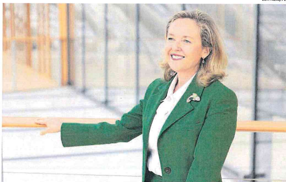
Nadia Calviño, presidenta del BEI y exministra de Economía, en Luxemburgo.

— La incertidumbre y el conflicto internacional evidentemente no favorecen el crecimiento económico. Por otra parte, en este contexto, Eu-