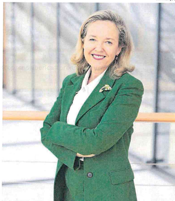
Nadia Calviño, fotografiada en Luxemburgo, durante el Tercer Foro organizado por el BEI.

— Todos estos informes señalan tres palancas claves para la competitividad y la fortaleza de Europa: integración de mercados, simplificación y movilización de inversión a gran escala. El BEI está ayudando a avanzar en las tres. He dedicado mucho tiempo a lo largo de mi carrera a impulsar la unión de mercados de capitales, tanto en mi responsabilidad en la Comisión Europea como después, como ministra y vicepresidenta del Gobierno de España. Ahora tengo otro papel. El BEI es un instrumento de Unión de Mercados de Capitales, por cuanto emite deuda bajo una bandera europea para canalizar el ahorro hacia inversiones