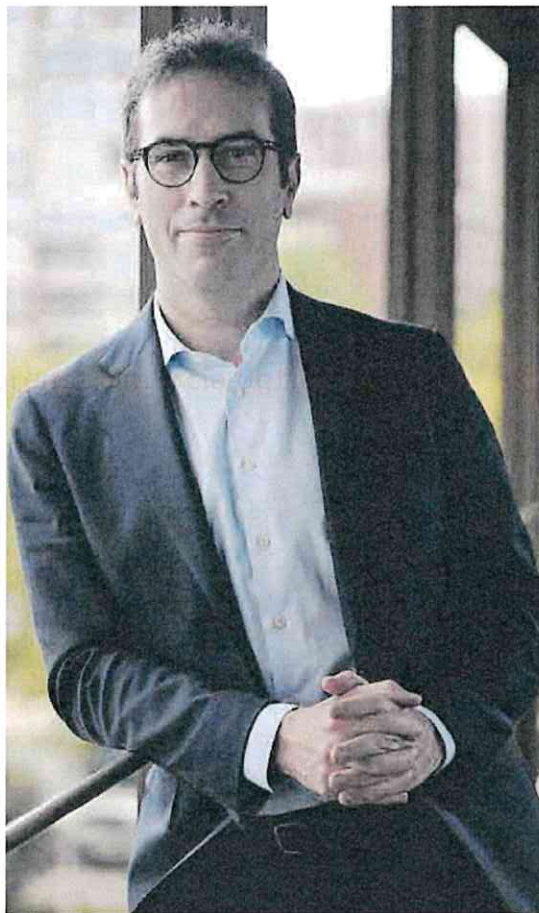
Carlos Cuerpo, ministro de Economía, Comercio y Empresa.

— No hay absolutamente ninguna influencia de Junts ni de ERC ni de ningún otro partido político en la