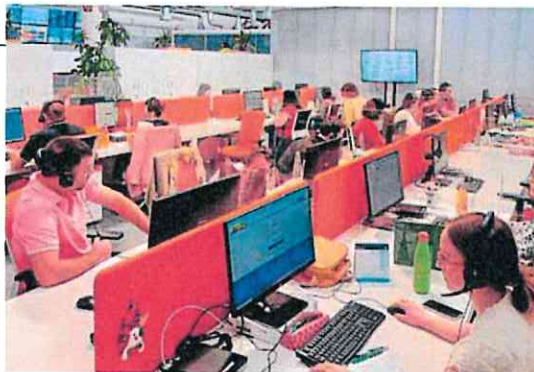
Centro de atención ciudadana de la Agencia Tributaria en la Región. CARM

LV. Una docena de técnicos y especialistas de la Agencia Tributaria de la Región de Murcia se han incorporado como refuerzo para la atención ciudadana durante la campaña de la Renta. Estos profesionales, que comenzaron a desempeñar su labor el pasado martes 6 de mayo, prestan atención y asistencia tanto telefónica como personal a los contribuyentes en las oficinas de Murcia y Cartagena. La medida se enmarca dentro del acuerdo que mantiene la Consejería de Economía, Hacienda, Fondos Europeos y Transformación Digital