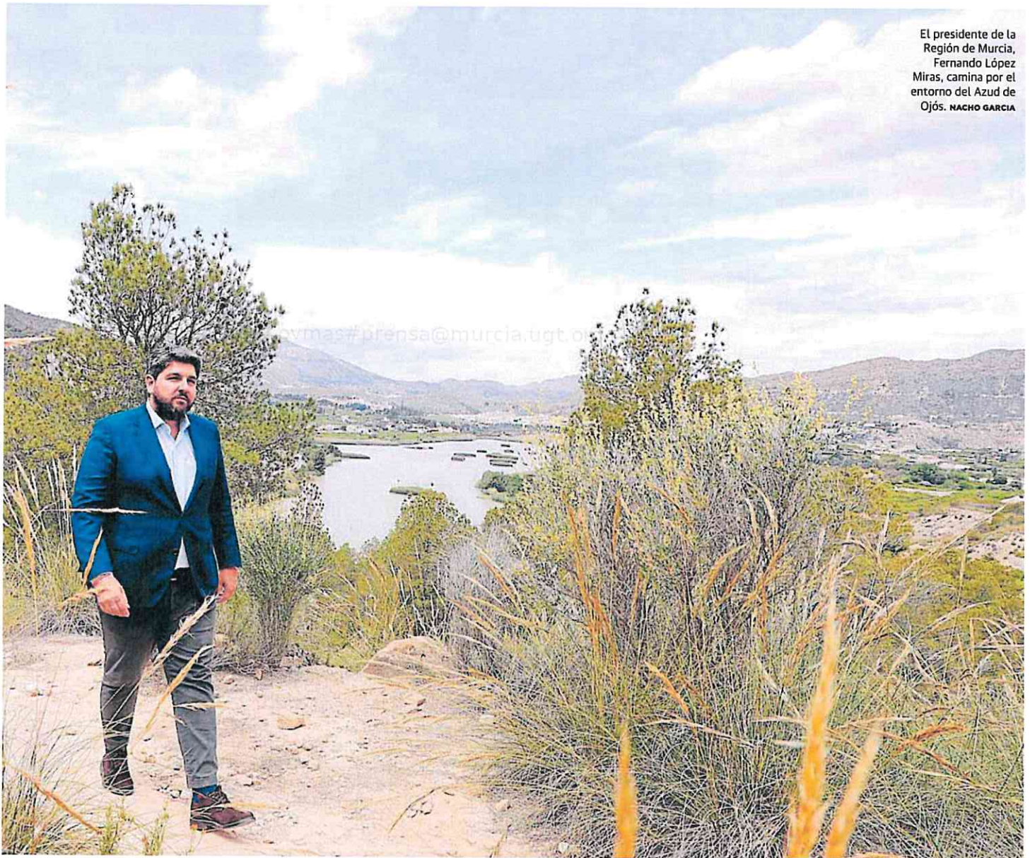
El presidente de la Región de Murcia, Fernando López Miras, camina por el entorno del Azud de Ojós.

líticas, a veces incluso populistas, pero que cuando se contrastan con la realidad pierden toda la veracidad. En España están sin Presupuestos Aragón, Castilla y León, Baleares e incluso la Comunidad Valenciana no los ha aprobado todavía. Miren, el Gobierno de la Región de Murcia quiere que haya Presupuestos no por una razón de beneficio político, sino porque cree que es bueno que a los ciudadanos de la Región se les siga bajando impuestos, que cuenten con más dinero para sanidad, educación y políticas sociales. Otros partidos hablan de muchas condiciones, pero pienso que se olvidan de que lo importante de unos Presupuestos no es ver satisfecho tu ideal político, sino el millón seiscientos mil hombres y mujeres que viven en la Región de Murcia. Yo si soy consciente de esto