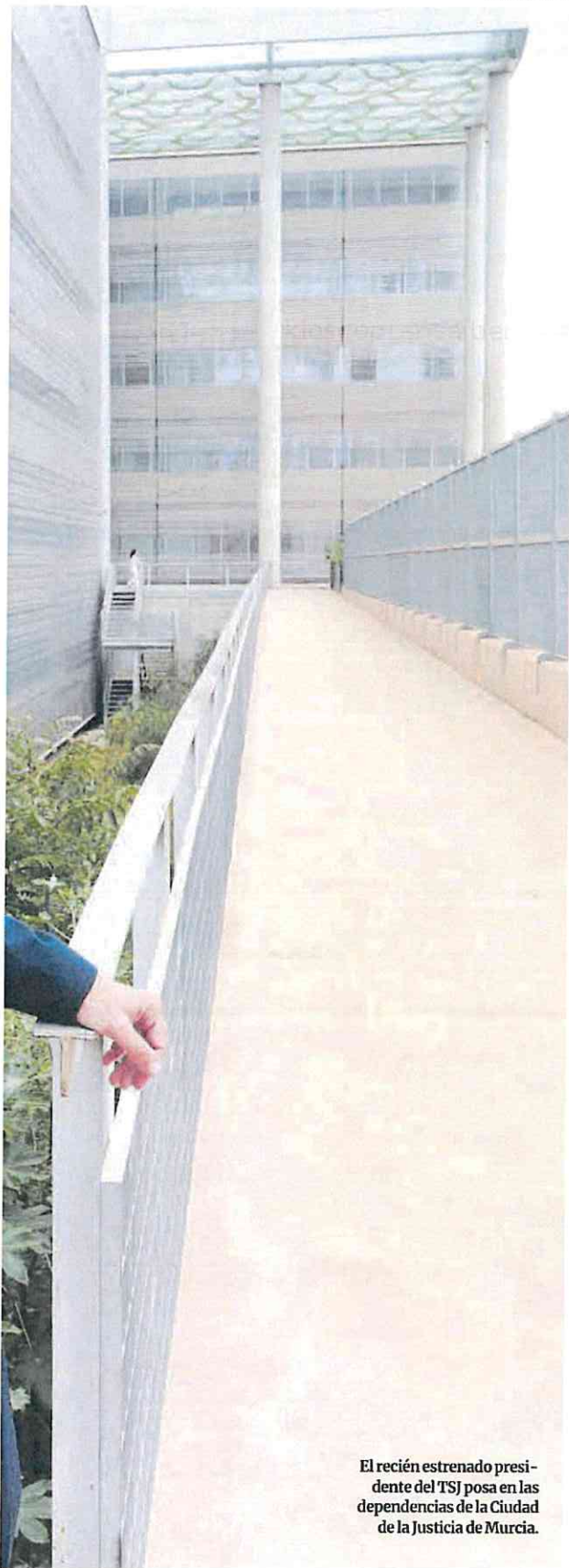
El recién estrenado presidente del TSJ posa en las dependencias de la Ciudad de la Justicia de Murcia.