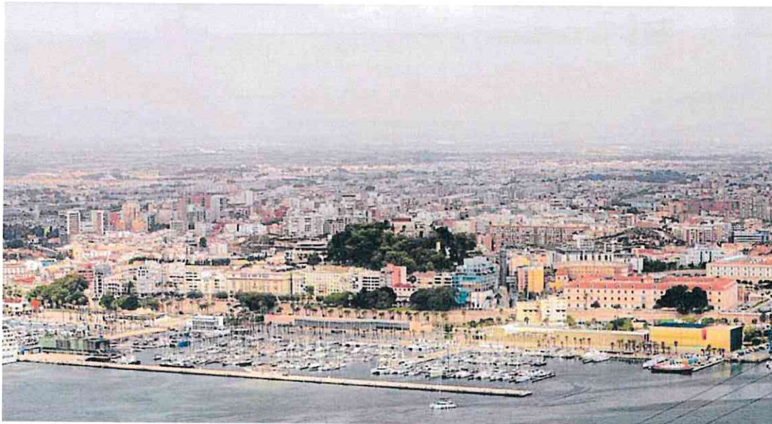
Vista aérea de Cartagena, con la terminal de Juan Sebastián Elcano, la Muralla del Mar y el castillo de la Concepción en primer plano.