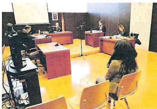
Un momento del juicio que tuvo lugar en el Juzgado de lo Social Nº 1.