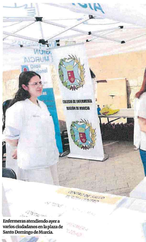
Enfermeras atendiendo ayer a varios ciudadanos en la plaza de Santo Domingo de Murcia.