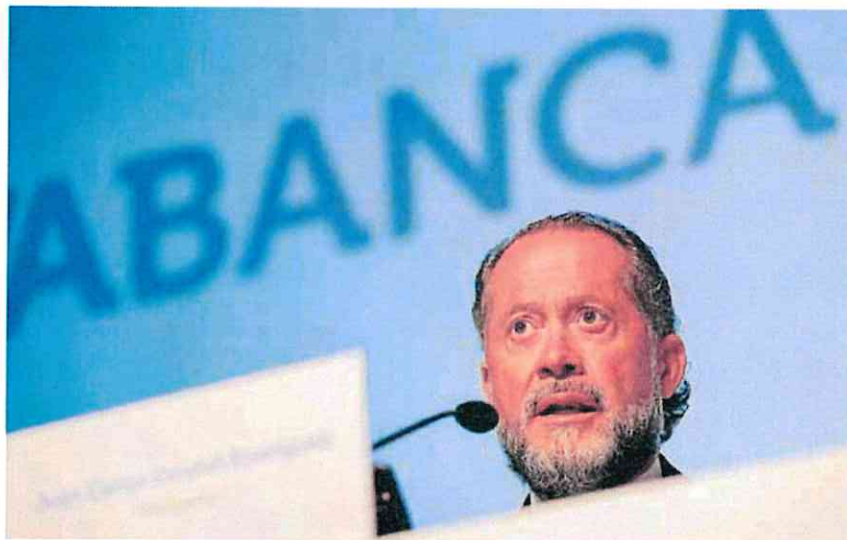
El presidente de Abanca, Juan Carlos Escotet.

Consciente de que «este país necesita pymes más grandes», apuesta por «acompañar cada proyecto empresarial desde el primer minuto» y ayudarles a trazar «un camino de ilusión que oriente su día a día» con la vista puesta en la internacionalización y exportación.