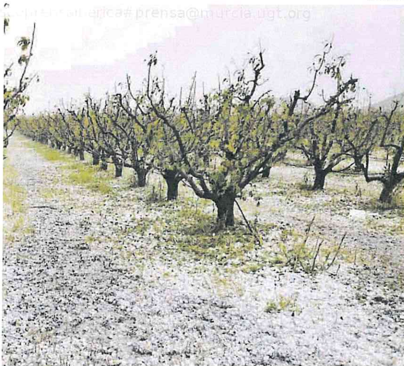
Destrozos en campos del Altiplano, en concreto en Jumilla, tras la granizada del pasado fin de semana.

La consejera de Agricultura, Sara Rubira, que este lunes por la tarde asistía en la capital de España a la reunión sectorial de Agricultura, ya adelantó que iba a pedir al ministro del ramo, Luis Planas, una línea de ayudas destinada a los agricultores que han perdido sus cosechas por este episodio. «En la Región de Murcia hay plantaciones completamente arrasadas por el pedrisco. Se ha perdido la cosecha de este año y peligra la del siguiente por los daños en la madera de frutales, almendros y otros cultivos que también se han visto