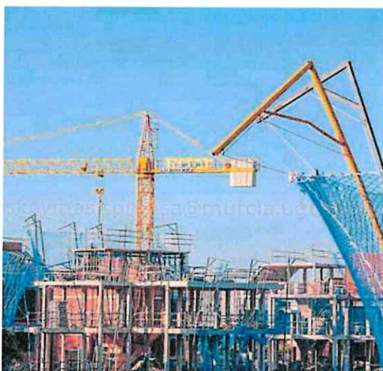
Un bloque de viviendas en construcción. ANTONIO LÓPEZ DÍAZ

El presidente del CES, Antón Costas, mostró su enorme preocupación por lo que se ha convertido en un «problema estructural» de España que no permite a un tercio de la población mejorar sus condiciones de vida. «La vivienda está actuando como un enorme agujero negro que se traga la mejora de rentas de la economía», advirtió durante la pre-