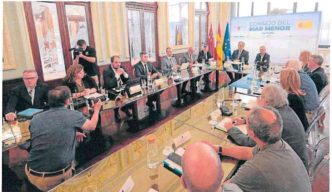
Constitución del Consejo del Mar Menor, ayer, en una de las salas del Casino de Murcia.