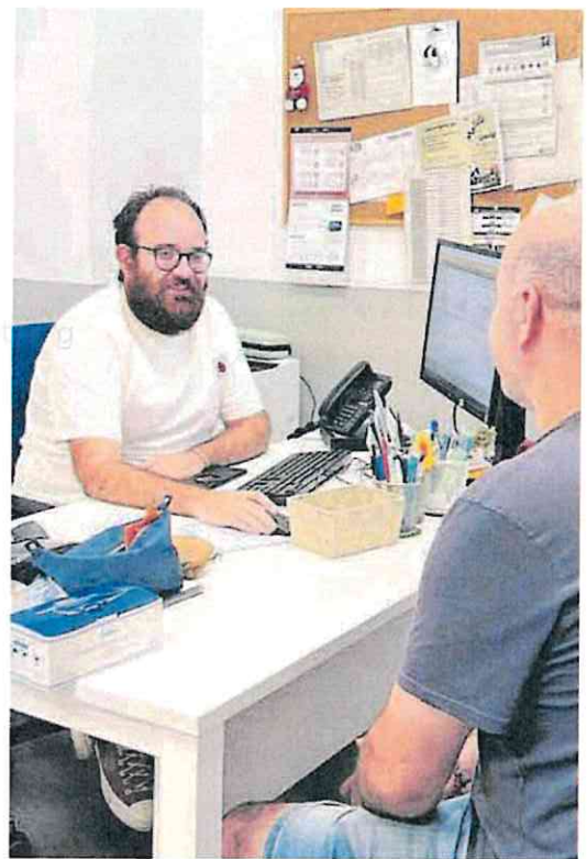
Un médico de familia atiende a un paciente en consulta.

Murcia está entre las autonomías con mayor cobertura para médicos de Atención Primaria