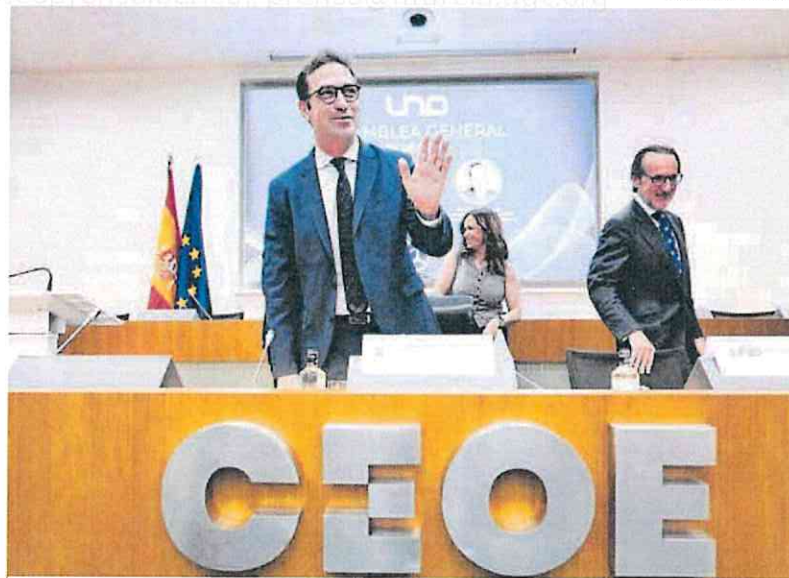
El ministro de Economía, Comercio y Empresa, Carlos Cuerpo, en un acto celebrado ayer en Madrid.

El Ejecutivo no puede prohibir la opa, sino que tiene que optar entre confirmar la decisión de la CNMC, aprobar la operación sin condiciones, o imponerle otras distintas mediante un acuerdo que «deberá estar debidamente motivado en razones de interés general».