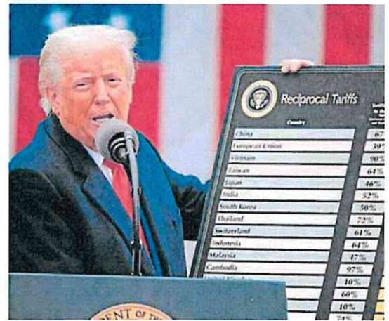
Trump, el pasado 2 de abril mostrando la lista de aranceles.

¿Y si el varapalo judicial a los aranceles fuera parte del plan para consolidar el poder? Hace casi un año el alto tribunal, en el que Trump nombró a tres de los cinco jueces que conforman la mayoría conservadora, expandió desorbitadamente el poder presidencial al pronunciarse sobre su inmunidad, cerrando de facto todos los casos judiciales que enfrentaba. La ilegalidad constitu-