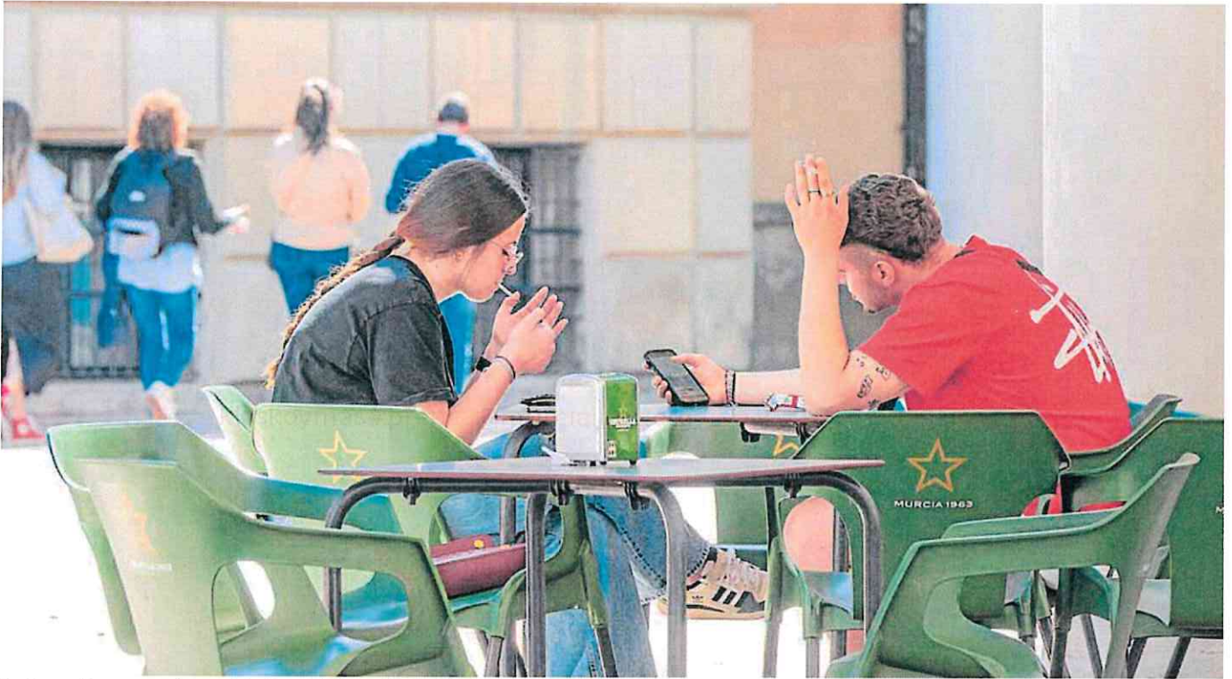
Dos jóvenes fuman en una terraza de la plaza de la Universidad, en Murcia.